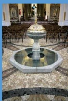
CAPELA BEATO LLUÍS MARIA MONTI