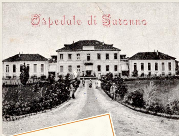
Ospedale di Saronno