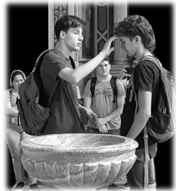
24 luglio: emozioni spirituali attorno al Fonte battesimale nella chiesa san Pancrazio di Bovisio