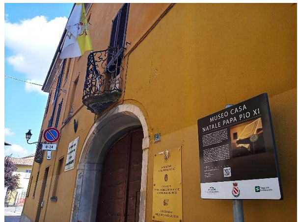
La casa natale di papa Pio XI, dove i religiosi di Padre Monti accolsero gli orfani dal 1925 al 1948.

Dopo le tappe di Cesano Maderno e di Varedo, lunedì 20 luglio (ore 21) saremo a Desio (foto a destra) per proporre la preghiera del Rosario nella città in cui Luigi Monti e compagni subirono 72 giorni di carcere. Trasmissione in diretta sul sito www.spuntidifuturo.it oppure link YouTube: https://youtu.be/QPTgrMeHfSY